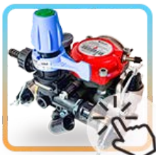
Comprar bombas Membranas