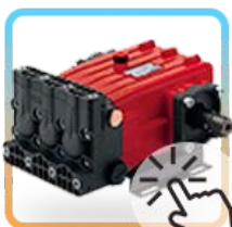
Comprar bombas Pistones