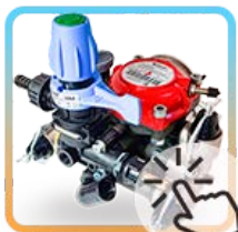
Comprar bombas Membranas