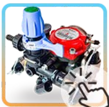
Comprar bombas Membranas